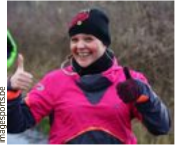
On a repris le Challenge l'Avenir avec le sourire, à Heusy.

Après le jogging, place à la détente : la piscine du complexe Kineo était bien remplie, une conclusion agréable pour les coureurs.