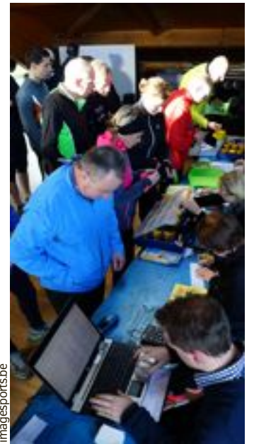
De nombreux coureurs lors des inscriptions.