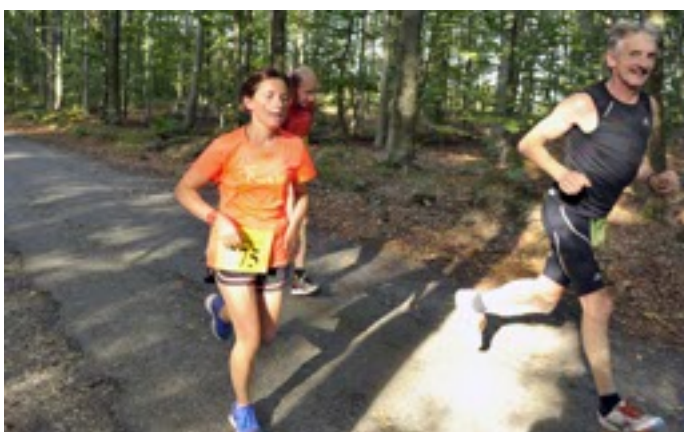
Une partie du parcours était dans les bois.