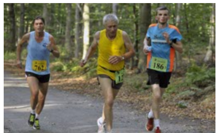
Ici aussi, il a fallu supporter la chaleur.